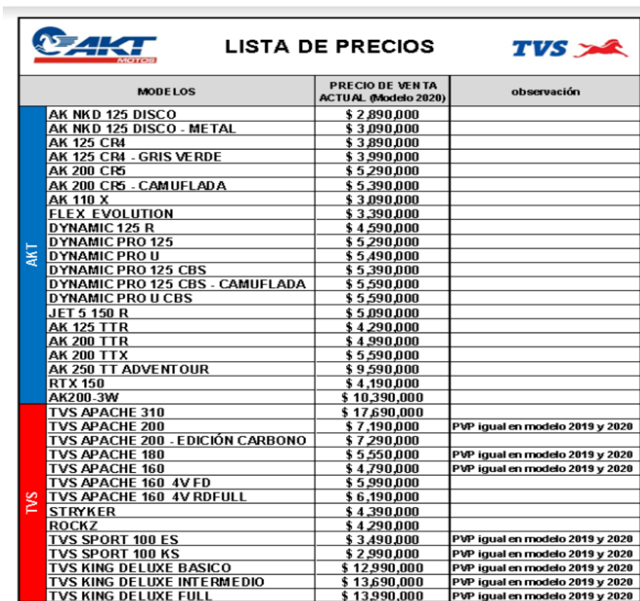
Ilustración 1 Lista de precios.

Catálogo: La empresa Moto Cubico S.A.S dentro de su catálogo de negocios maneja una amplia variedad de motos según color y cilindraje