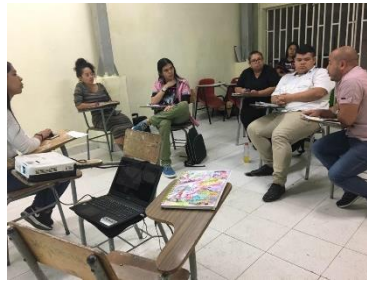
Formación a líderes comuna 1 - 2020

Con la finalidad de ampliar la oferta institucional brindada por el Sistema de Alertas Tempranas y generar comunidades protectoras; se busca generar procesos formativos alternos con otros actores incidentes de la comuna 1, por tanto se realizan convocatorias a líderes comunales y juveniles, representantes de organizaciones base, representantes institucionales y actores influyentes en el territorio que estuvieran dispuestos a vincularse al proceso y ser formados como agentes protectores.