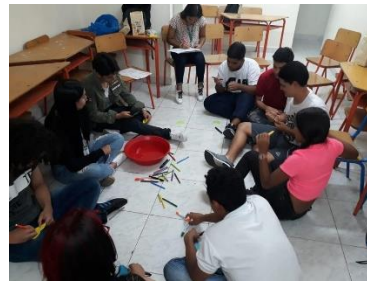
Formación grupo CARPEDIEM - líderes juveniles - 2019