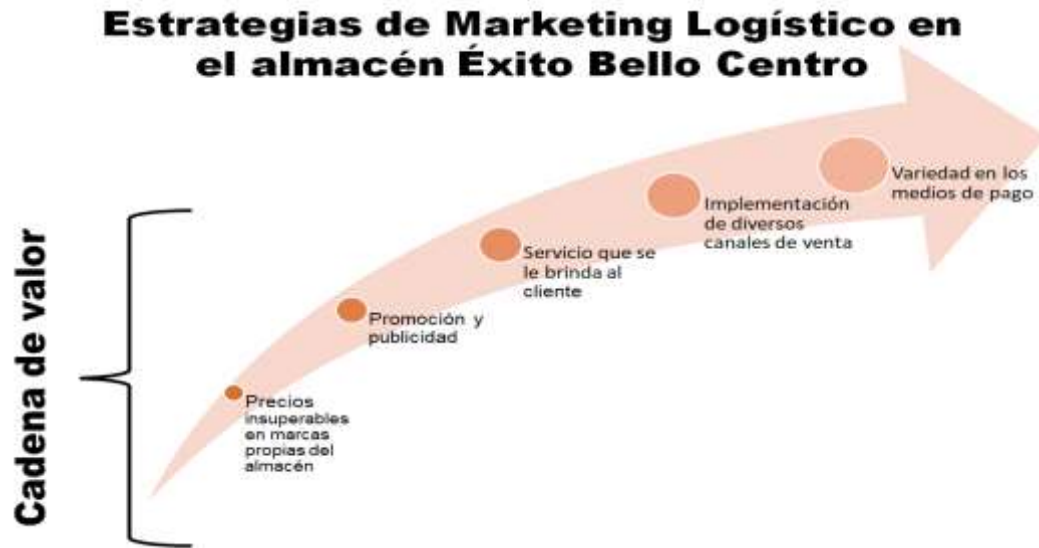
Figura 3. estrategias de marketing logístico en almacenes Éxito Bello Centro. Elaboración propia.

Como se puede evidenciar en la figura 3, las estrategias del almacén tienen una correlación que permite el cumplimiento de los objetivos de la organización en cuanto a la cadena de valor, desempeño, sostenibilidad y competitividad permitiendo generar ventaja competitiva. Esta herramienta permite analizar todas las actividades que se realizan en la empresa desde la materia prima hasta el cliente final, por medio de la utilización de las estrategias, una de ellas es la de precios insuperables, la cual garantiza al cliente el precio más bajo en cuanto a las marcas propias de productos o servicios del almacén, asimismo, se destaca dentro de este formato la promoción y publicidad, amplia selección de productos, variedad de marcas, precios competitivos y atractivos para los diferentes niveles socioeconómicos.