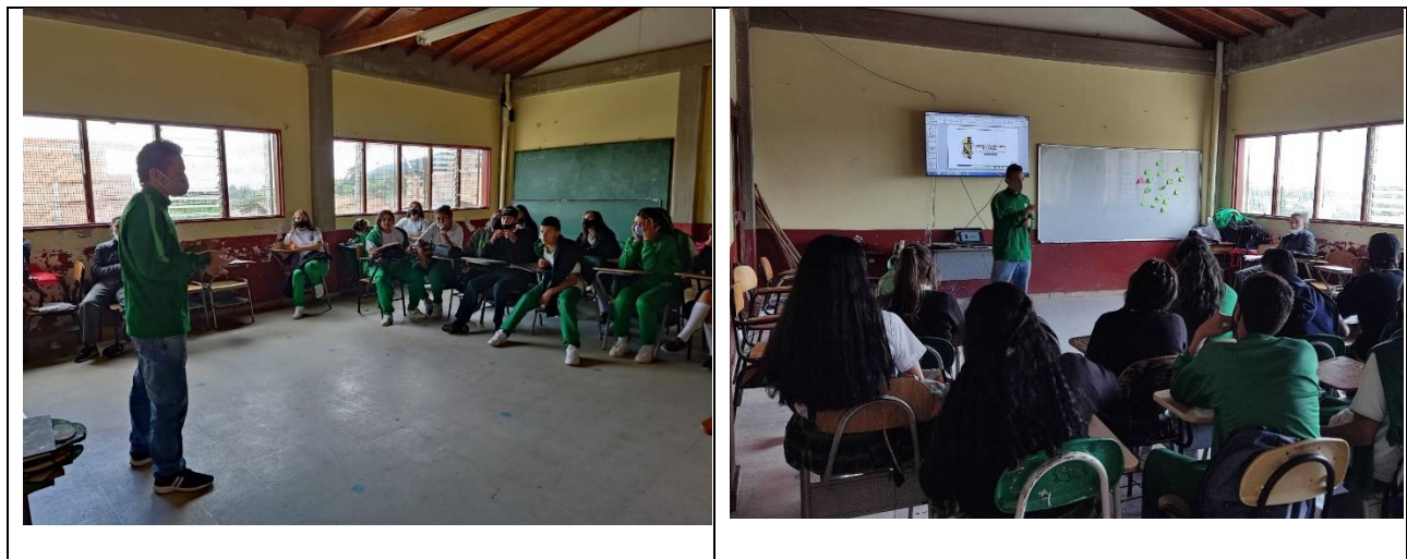
Imagen 3. Capacitaciones solicitadas en la Institución Educativa del Corregimiento de Ovejas.

Para dar cumplimiento a la segunda función de las prácticas realizadas se expone la capacitación por solicitud de entidades, realizando esta actividad en instituciones educativas como la institución educativa del corregimiento de ovejas, en la cual se expusieron temáticas asociadas a la gestión integral de los residuos sólidos.