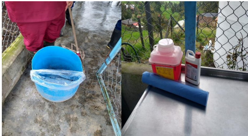
Imagen 1. condiciones actuales de separación de residuos sólidos generados en el albergue municipal.

recipiente de los residuos no cumplen con las especificaciones para garantizar el transporte, aumenta la posibilidad de derrames, que pueden conllevar a afectaciones del personal encargado de realizar el transporte y disposición de estos. Se cuenta con guardianes para la disposición de residuos cortopunzantes, y se debe mencionar que en este caso los recipientes presentan los rótulos y especificaciones para realizar una adecuada gestión de este tipo de residuos. Sin embargo, los residuos orgánicos son depositados en una caneca de color negro, y son esparcidos por los pastizales cercanos al predio en el que se ubica el albergue, sin ningún tipo de tratamiento.