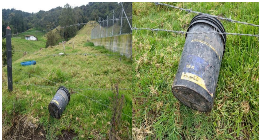
Imagen 2. Recipientes de Material orgánico generados por los caninos.