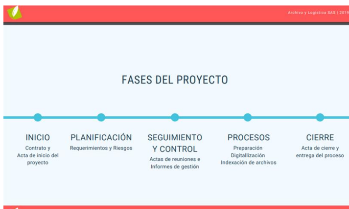
Información suministrada por Ranking S.A.S

Debido a lo anterior, se llegó a la conclusión de un proceso de implementación de herramientas que me permitan tener un mayor control de los pagarés y que puedan servir para agilizar procesos a la hora que de buscar un documento y evitar el riesgo de no encontrar dicha información.