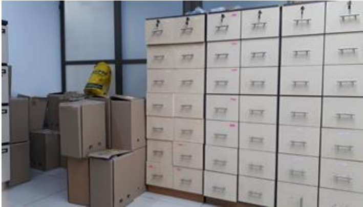
Foto tomada en el espacio laboral Ranking Sport S.A.S

Al contar con un espacio adecuado para los archivos permite que la búsqueda de los documentos requeridos se pueda obtener de una forma más fácil y rápida sin tener que destinar mucho tiempo en esta tarea.