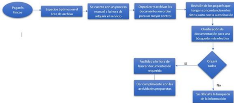
Flujograma del proceso de optimización de los pagarés físicos.

Elaboración propia en base a información suministrada por Ranking S.A.