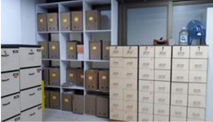
Foto tomada en el espacio laboral Ranking Sport S.A.S

Dentro del contexto que se percibe al ingresar al ejercer las prácticas profesionales se determina la gran necesidad que se tiene al contar con un buen control de los pagarés físicos. Por un lado, los procesos atrasados por motivos de la pandemia del Covid - 19 (transcurrida desde febrero del año 2020, hasta nuestros días) y porque en ocasiones no existe personal encargado que se encargue de solo el archivo de la empresa para llevarlo al día.