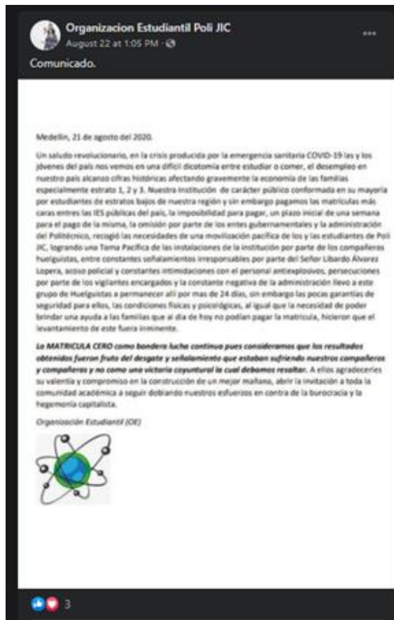
Ilustración 12 Publicación “Comunicado”