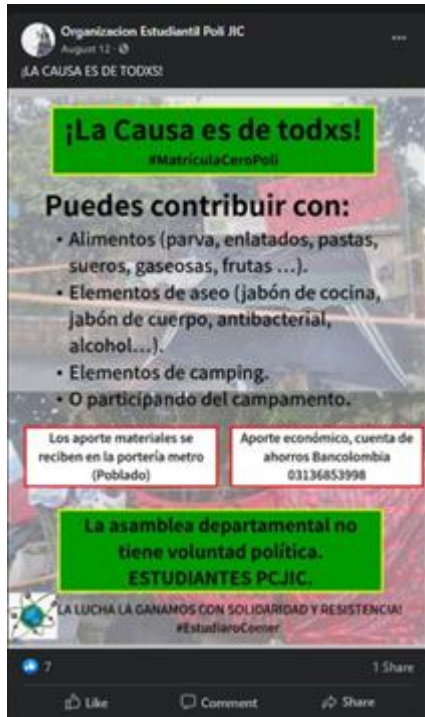
Ilustración 10 Publicación “La causa es de todxs”