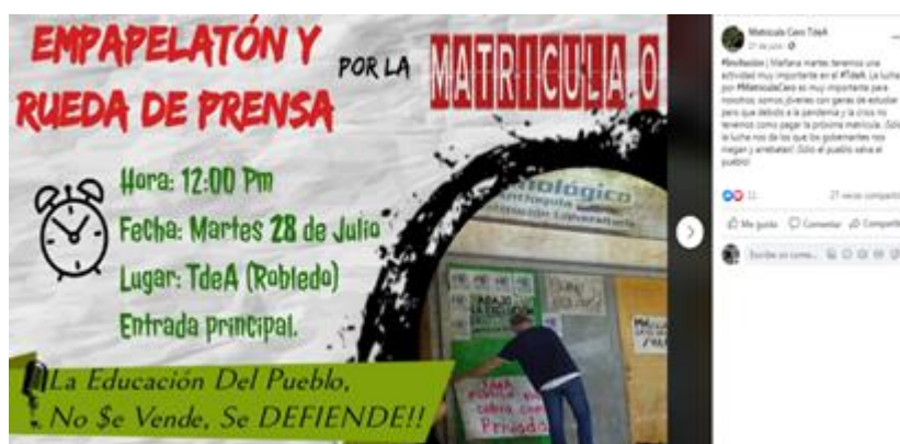
Ilustración 8 Publicación “¿Empapelatón y rueda de prensa”

Posteriormente, para el caso del Movimiento Estudiantil del Tecnológico de Antioquia, se inició con la difusión de una convocatoria por medio de las redes sociales, para realizar una “Empapelatón” del campus universitario con mensajes de exigencia para la garantización de la Matrícula Cero. (Ver ilustración 8. Empapelatón y Rueda de Prensa . 2020) Algunos estudiantes realizaron un grupo de WhatsApp en donde coordinaron la estrategia para tomarse el campus de manera pacífica y así se efectuó el inicio de la denominada Toma Popular Universitaria por la Matrícula Cero.