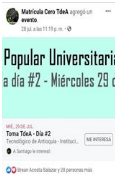
Ilustración 9 Publicación “Toma TdeA”