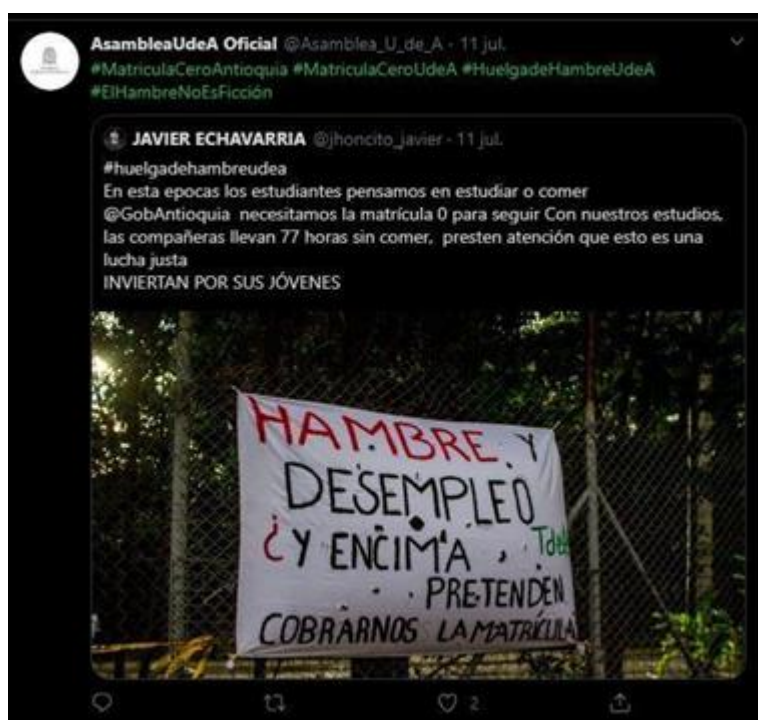
Ilustración 6 Fotografía “Hambre y desempleo”

Lo Anteriormente mencionado motivó a algunos y algunas de las integrantes del Movimiento Estudiantil a analizar algunos mecanismos de presión política que permitieran la consecución de los recursos que pudieran garantizar una Matrícula Cero para todas y todos los Estudiantes de todas las Instituciones de Educación Superior de la ciudad de Medellín y en sus diferentes sedes como se puede evidenciar en la siguiente fotografía ( ver Ilustración 6. Fotografía Hambre y Desempleo ).