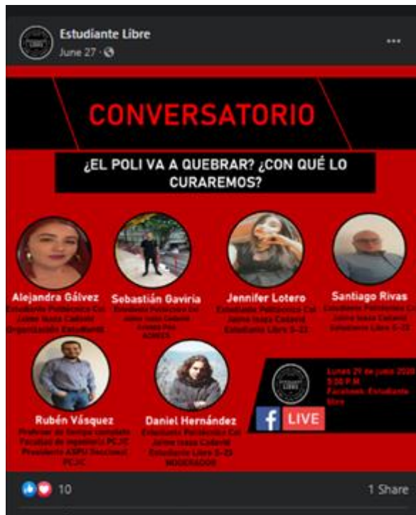
Ilustración 11 Publicación de Facebook “¿El Poli va quebrar?¿Con qué curaremos?”