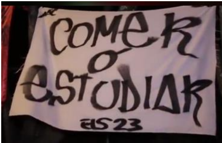
Ilustración 5 Fotografía “comer o estudiar”

A partir de los resultados de las caracterizaciones realizadas por los y las estudiantes del Movimiento Estudiantil, se intensifica la exigencia por la matrícula cero, que aunque ha sido la lucha que históricamente se ha planteado el Movimiento Estudiantil no ha trascendido más allá de una intención, pero el panorama es diferente al momento de la crisis sanitaria del Covid-19. Analizando el estado económico de las familias de los y las estudiantes, se logró identificar que muchos de ellos y ellas priorizaron las necesidades básicas del hogar por encima del pago de la matrícula, situación que desde el Movimiento Estudiantil fue denominada como ( ver ilustración5.Fotografía “comer o estudiar” ).