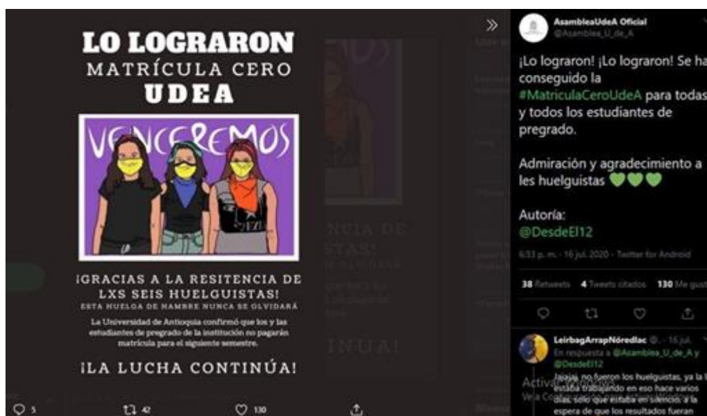
Ilustración 7 Publicación “Lograron matrícula cero UDEA”

En paralelo a lo anterior, desde el Movimiento Estudiantil se empezó a potenciar el uso de las redes sociales como Facebook, Instagram, WhatsApp y Twitter para difundir información actualizada y verídica sobre las situaciones que se presentaban al interior del campamento y la huelga de hambre, se publicaban mensajes y expresiones que manifiestan el apoyo, la importancia y la pertinencia de la realización de este tipo de mecanismos de acción para la obtención de tal logro. (Ver Imagen 7. Lograron Matrícula Cero UDEA)