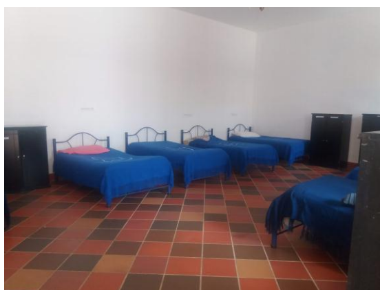
Ilustración 10 Habitación