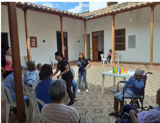
Ilustración 36 Fotografía Fundación 7

Fotografía tomada por el grupo de investigadoras