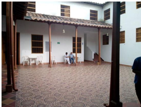
Ilustración 13 Patio interno