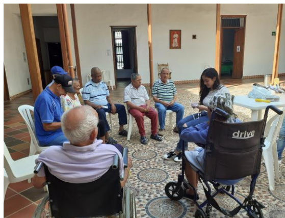
Ilustración 37 Fotografía Fundación 8