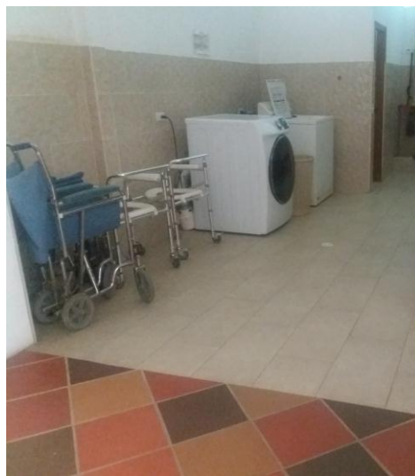
Ilustración 12 Zona de ropas

Tienen un patio amplio dentro de la casa como escenario de recreación y atención del adulto mayor y un jardín con vista hacia la calle, allí los adultos mayores se sientan a tomar el sol y tienen una pequeña huerta casera.