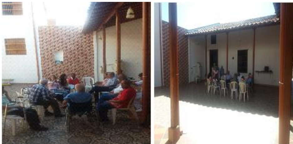
Ilustración 15 Primer encuentro con los adultos mayores