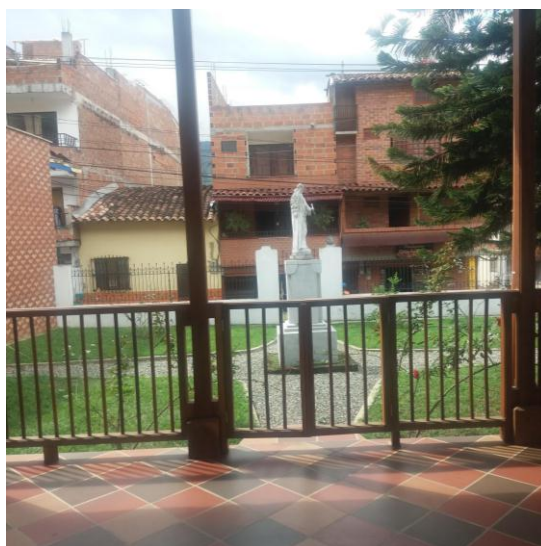
Ilustración 33 Fotografía Fundación 4

En el aspecto familiar de los adultos que residen en la Fundación, tres de ellos; dos mujeres y un hombre no tienen familia, pero desde lo económico cuentan con una red de apoyo que los subsidia completamente.