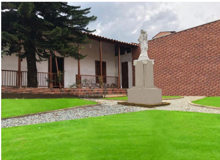
Ilustración 5 Nueva sede fundación Funam