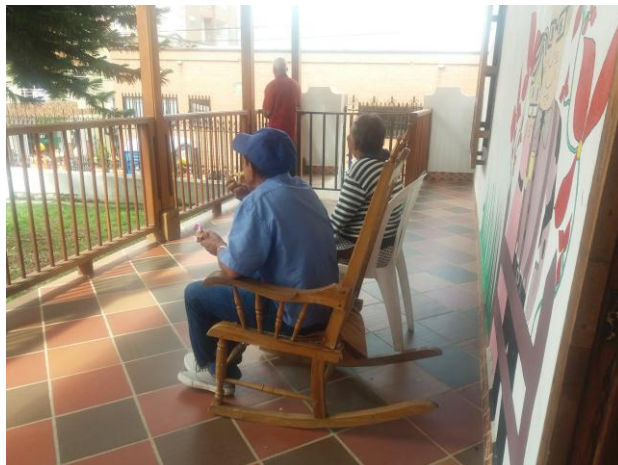
Ilustración 30 Fotografía Fundación 2