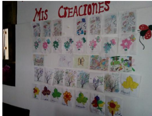
Ilustración 7 Mural mis creaciones