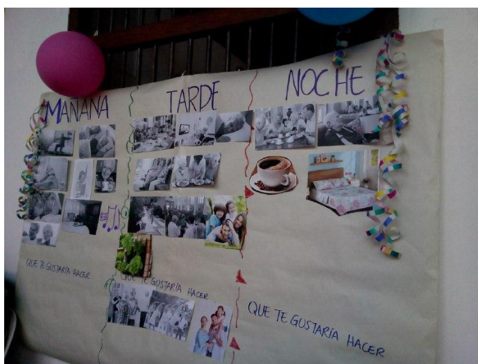
Ilustración 27 Mural de situaciones 1