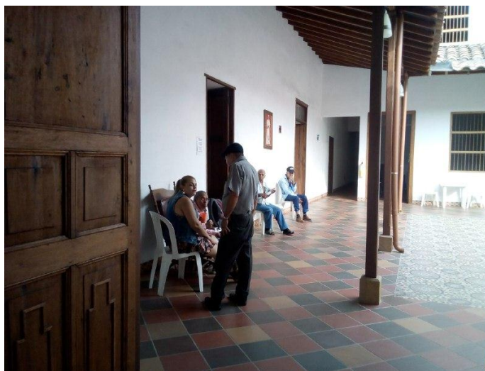
Ilustración 26 Fotografía Fundación 1