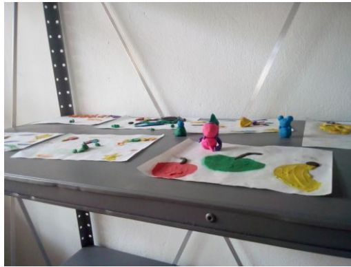
Ilustración 8 Creaciones

“Disponen de un mural donde se exponen algunos de sus trabajos, también disponen de una pantalla donde ellos pueden ver películas, documentales, noticias.” Psicóloga