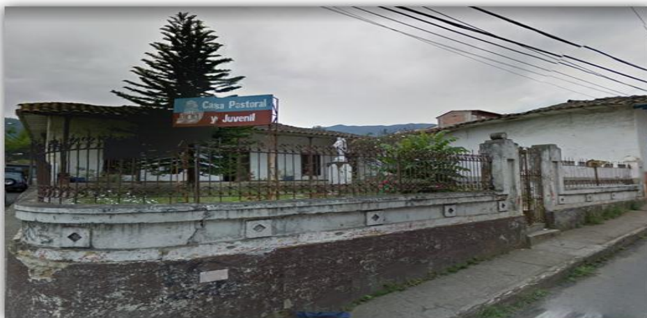
Ilustración 4 Antigua Casa Pastoral y Juvenil de Girardota