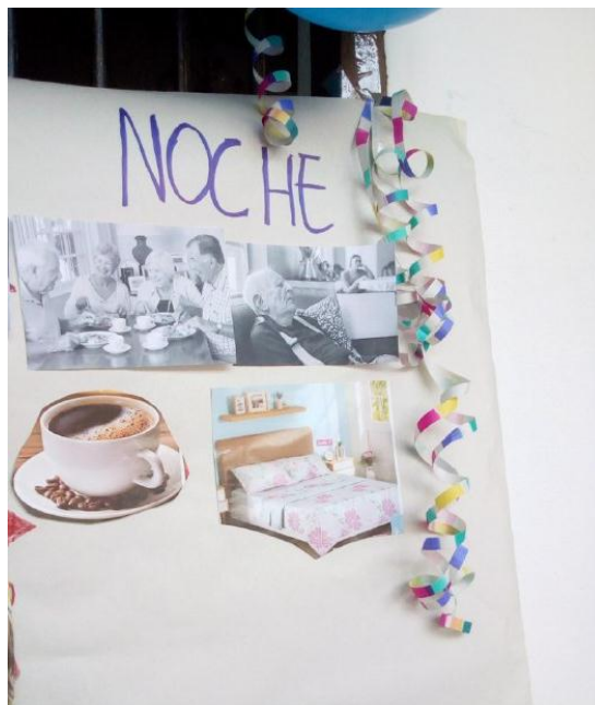
Ilustración 31 Mural de situaciones 4