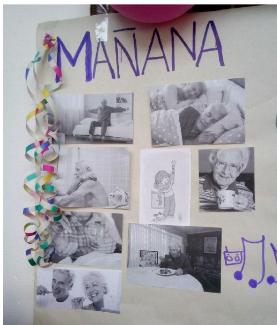
Ilustración 28 Mural de situaciones 2