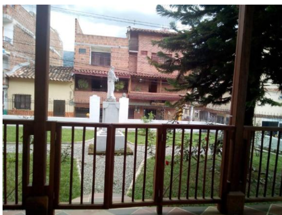
Ilustración 14 Patio externo

Lo anterior corresponde al primer acercamiento de la Fundación que tuvo que ver con el reconocimiento del lugar y, frente al conocimiento de las personas que lo habitan, se identificó que entre algunos habitantes prevalecen las enfermedades y trastornos mentales por lo que es preciso mencionar que la Fundación cuenta con un grupo de profesionales interdisciplinarios del sector de la salud y administrativos que buscan suplir las necesidades y superar las problemáticas que se