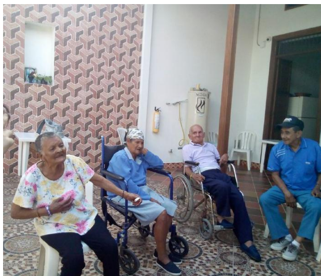
Ilustración 34 Fotografía Fundación 5