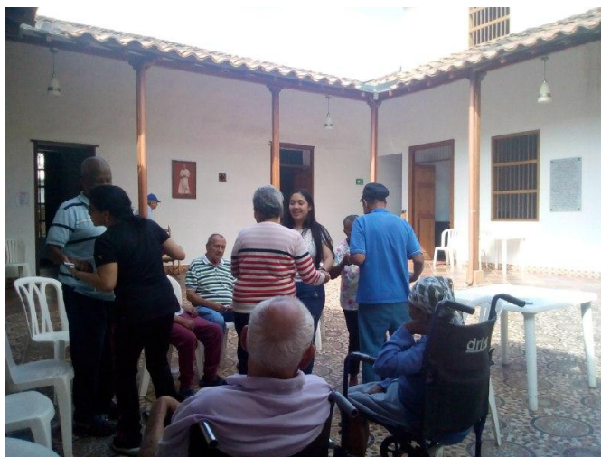
Ilustración 35 Fotografía Fundación 6