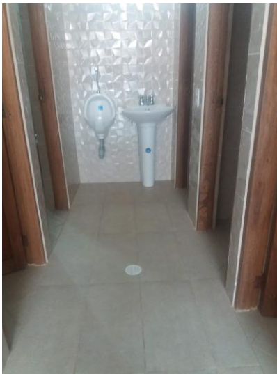
Ilustración 11 Baño