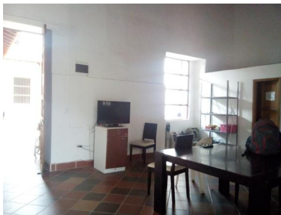
Ilustración 9 Salón y comedor